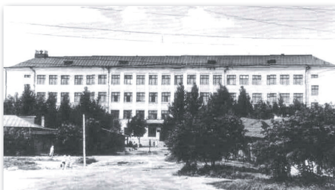
Здание института на ул. Долгирева, 60, 1944 г.

ное, что усложняло педагогический труд офицера, – серьёзные проблемы со здоровьем.