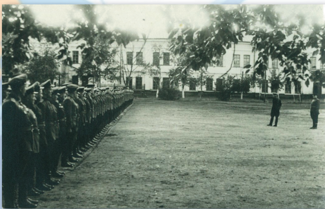
Построение Камышинского танко-технического училища, 1942 г.