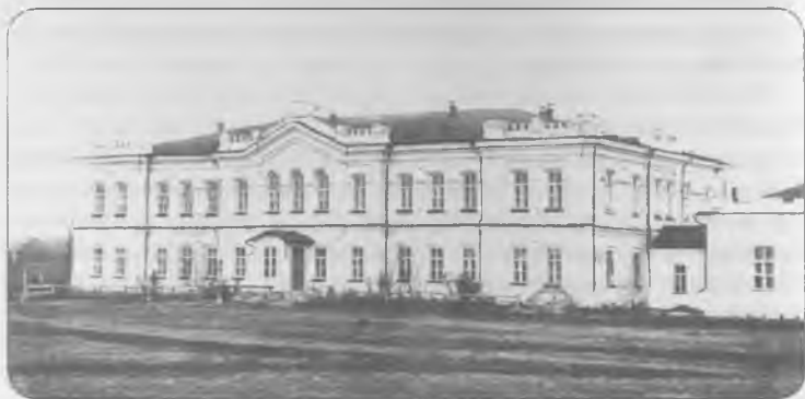
Здание 1-й Омской мужской гимназии. Омск. 1896 г. Building of the 1st Omsk Men Gymnasium. Omsk, 1896.