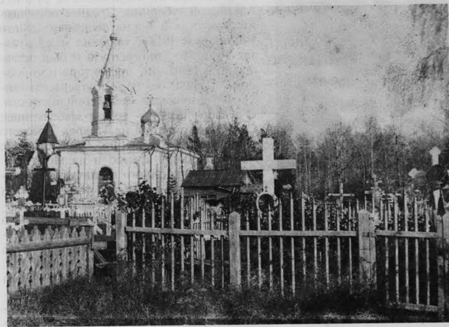
Казачье кладбище. 1902 г.