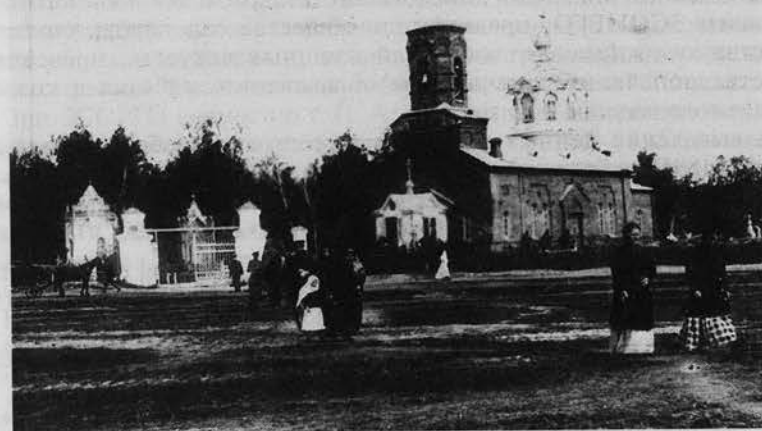
Вход на Шепелевское кладбище у церкви Во имя Павла Комельского Чудотворца. ГУ ГАОО. Фотофонд. № 58