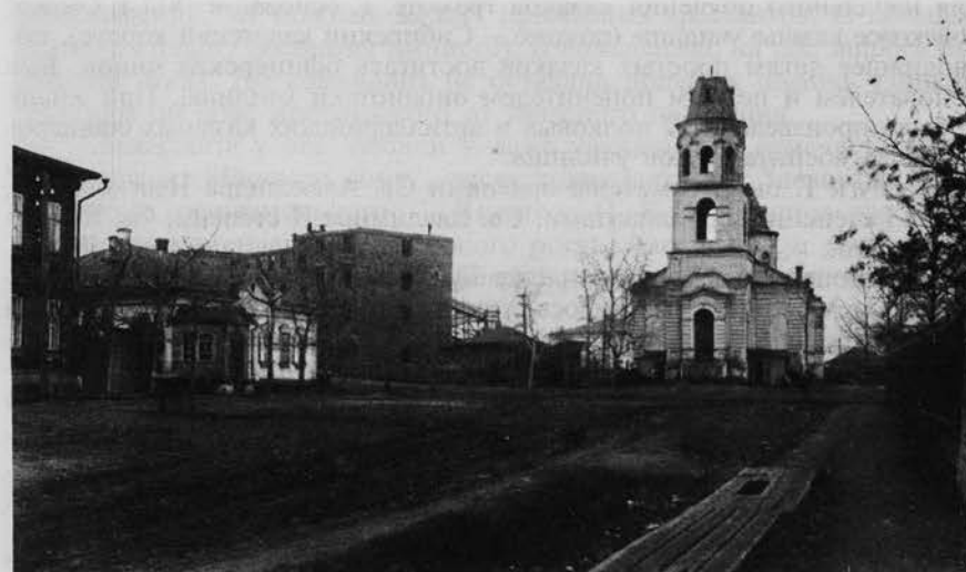
На месте Бутырского кладбища. 1940 г.