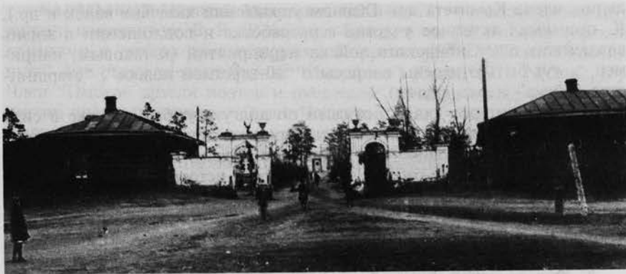
Вход на Казачье кладбище. 1940 г.

Будучи равнодушным к делу народного образования, К. не только сам занимался педагогической деятельностью (был воспитателем и преподавателем в Сибирской военной гимназии), но и, находясь на военно-административных должностях, активно содействовал развитию школьного дела в Сибирском казачьем войске. Так, после его ухода в отставку практически в каждом поселении сибирских казаков имела своя школа.