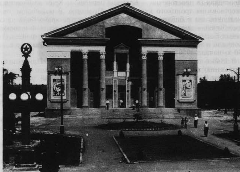
Кинотеатр им. Маяковского. На этом месте находилось городское кладбище.