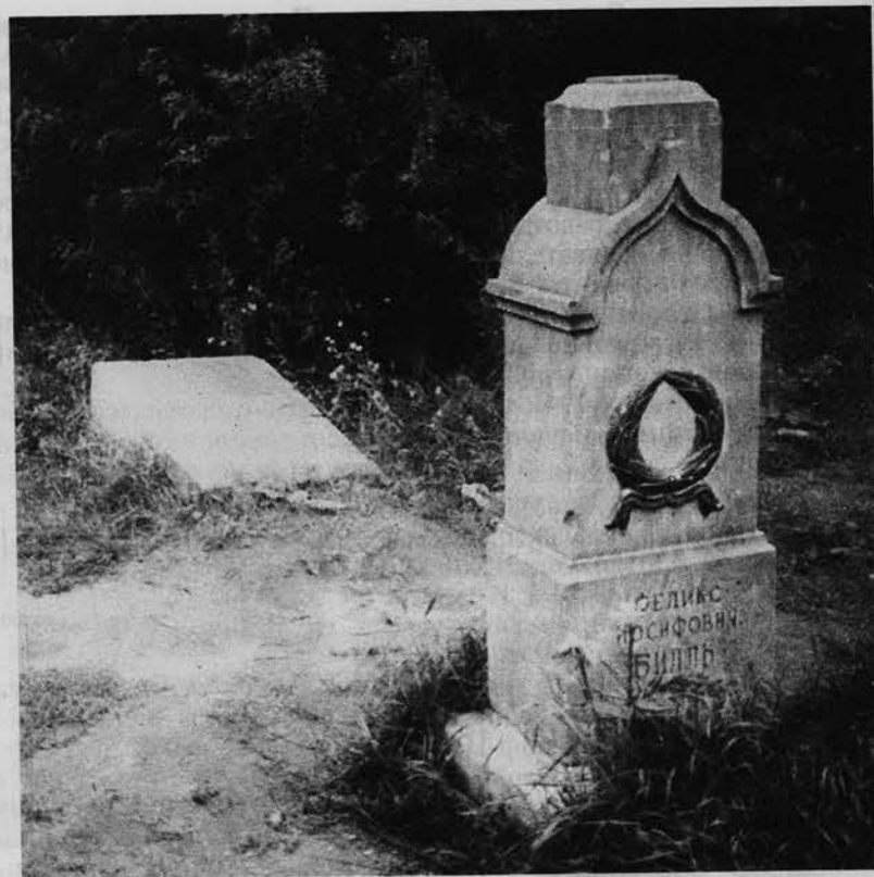
Могилы Ф. И. Билля и П. Л. Драверта. Сентябрь 1954 г.

В январе 1920 г. Б. мобилизован в Красную Армию. Зачислен ординатором 1-го Канского военного госпиталя, затем — пом. главврача перевязочного отряда 104-й бригады 35-й дивизии. В 1921 г. в качестве делегата от врачей 5-й армии был послан в Москву на организационный съезд медиков. По возвращении — старший врач 105-й бригады 35-й