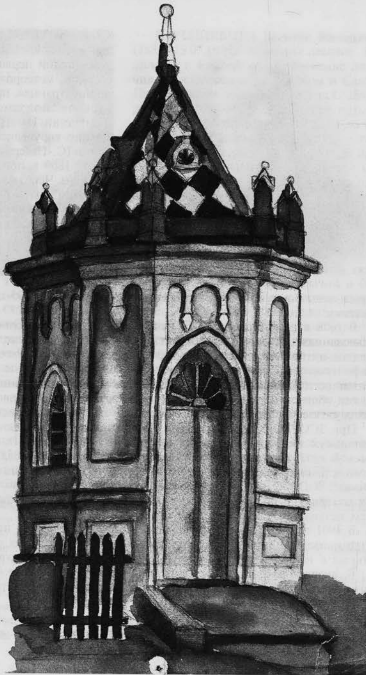
Рисунок часовни на Шепелевском кладбище. Лето 1926 г. (студентки Поповой – 1-й курс ж.-д. отд.). ГУ ГАОО. Ф. 2200. Оп. 1. Д. 131. Л. 14.

ГОЛУБЦОВ Александр Савватиевич (Саввич) (1829–27.03.1881) – архитектор. Родился в Вологде. Работал в Пскове, Омске.