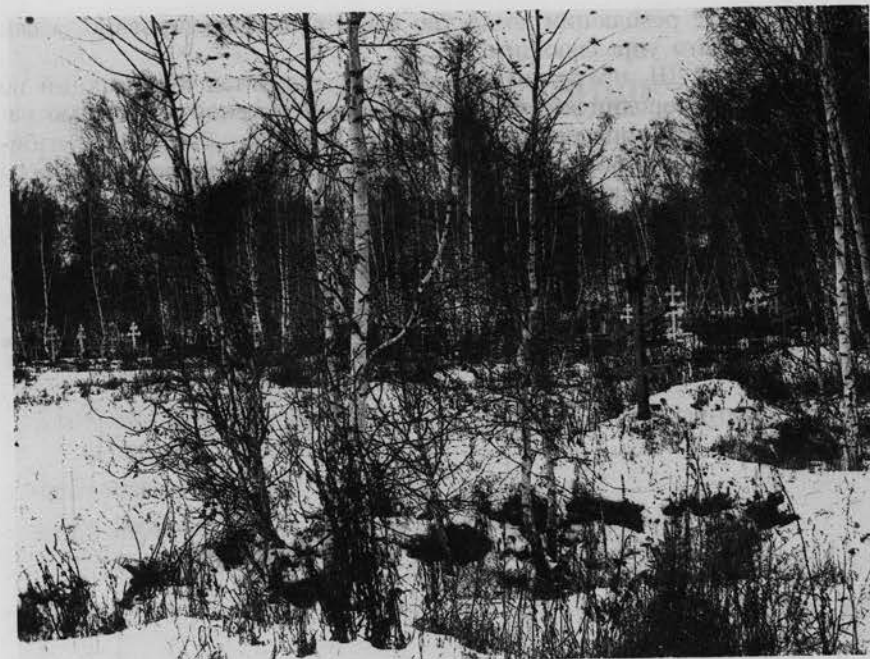
Вид на Шепелевское кладбище. 1914 г. ГУ ГАОО. Ф. 2200. Оп. 1. Д. 131. Л. 4–5.

В 1916 г. — участник Всероссийской переписи на территории Северного Казахстана. Певец и хормейстер-любитель. В 1914–1918 гг. Ш. являлся регентом ученических хоров, в его ведении находился оркестр струнных инструментов. Он же руководил и драматическими кружками. С 1921 г. преподавал на рабфаке. В конце 1920-х — начале 1930-х гг. — библиотекарь в Омском ветеринарном институте.