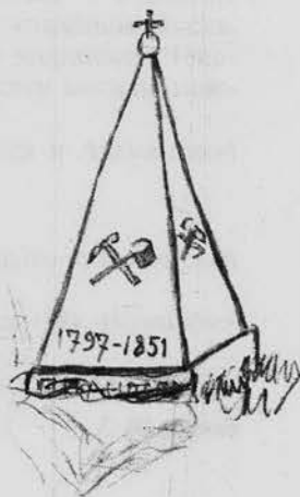
Рисунок Н. Д. Чернокова памятника на могиле П. П. Аносова. Бутырское кладбище. Июнь 1927 г.

В личном фонде А. Ф. Палашенкова имеется письмо омика, жившего в 1929–1931 гг. рядом с Бутырским кладбищем и описавшего могилу Павла Петровича: “С восточной стороны Братской церкви стоял мраморный обелиск с прямоугольным цоколем высотой около 3 м... Верх его был увенчан бронзовым