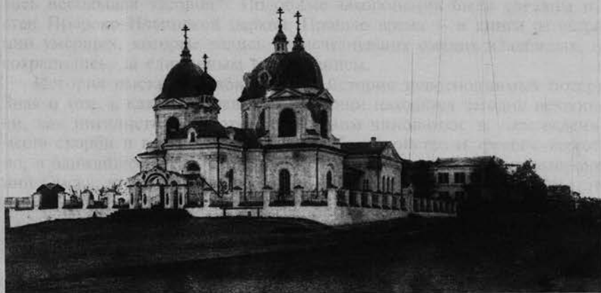
Пророко-Ильинская церковь ГУ ГАОО. Фотофонд. № 128