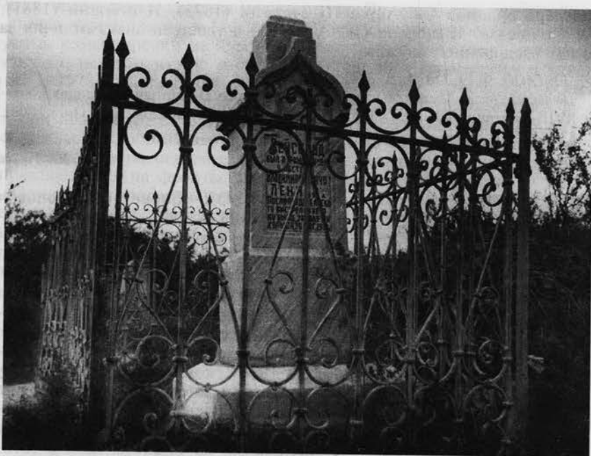
На могиле Б. С. Вейсброда. Сентябрь 1954 г. Фото А. В. Борисова. ГУ ГАОО. Ф. 2200. Оп. 1. Д. 130. Л. 101

ГЕЙДЕ Вильгельм Карлович (октябрь 1824—?) — акмолинский областной архитектор. 12 ноября 1843 г. окончил С.-Петербургскую Императорскую академию художеств. Получил звание неклассного художника архитектуры. 12 февраля 1844 г. зачислен в штат Казанской удельной конторы архитектором. 6 февраля 1846 г. уволен из Департамента уделов. С 4 ноября 1848 г. по 2 августа 1852 г. — севастопольский городской архитектор. 14 июня 1853 г. за оказанное искусство и познания в архитектуре возведен Императорской академией художеств в звание академика архитектуры. Получил чин титулярного советника. С 1 августа 1854 г. по 24 марта 1857 г. — старший архитектор и член управления VI округа корпуса инженеров военных поселений. С 1 декабря 1862 г. по 22 апреля 1866 г. — архитектор Павловского института. Тогда же прикомандирован к канцелярии Опекунского совета. С июня по сентябрь 1867 г. — занятия в технико-строительном комитете МВД.