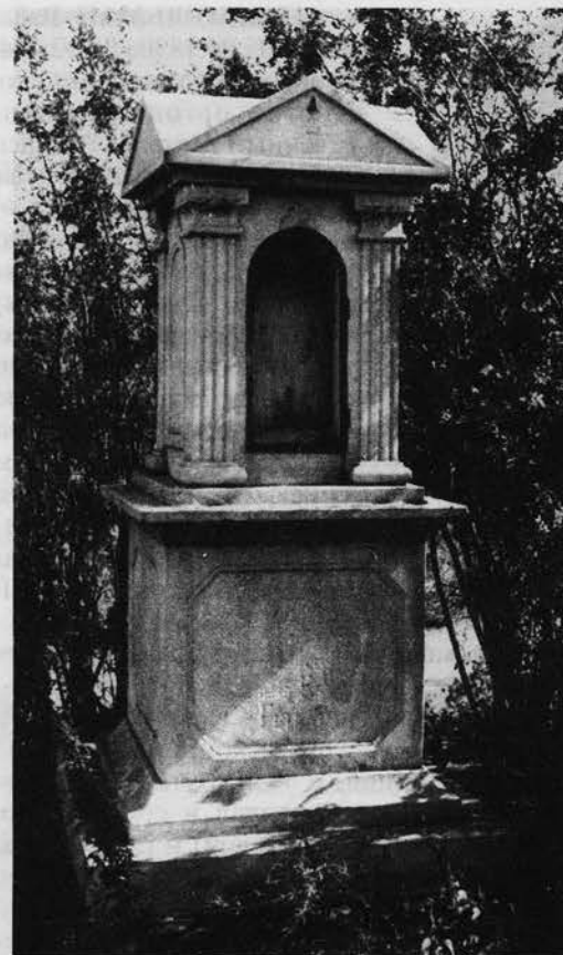
Памятник на могиле Акмолинского областного архитектора В. К. Гейде. Сентябрь 1954 г. ГУ ГАОО. Ф. 2200. Оп. 1. Д. 130. Л. 99

7 сентября 1876 г. приказом МВД назначен архитектором при военном губернаторе Области сибирских киргизов. 16 декабря 1868 г. приказом генерал-губернатора Западной Сибири назначен акмолинским областным архитектором. Выполнял его обязанности в 1868—1888 гг. Участвовал в перестройке Сибирской гимназии в Омске. 1867 г. — надвор-