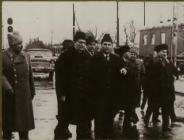
Встреча на ж/д вокзале члена Политбюро и Президиума ЦК КПС С. секретаря ЦК КПС М. А. Суслова. 1971