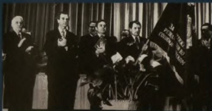
Вручение Омской области Переходящего Красного Знамени. Омск, 1975