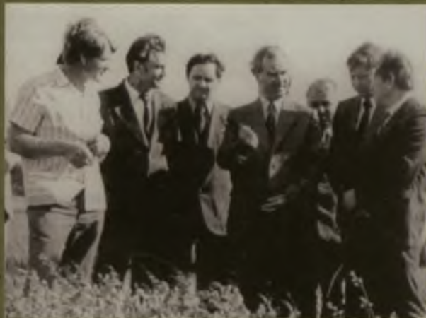
На полях СибНИИХХИ, 1961

партии, где более трех лет возглавлял сельхозотдел, затем был избран председателем исполкома Ставропольского краевого Совета депутатов трудящихся.