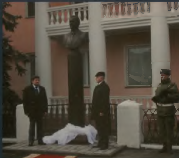
Мэр города Омска В. В. Двораковский и губернатор Омской области В. И. Назаров у памятника-бюста С. И. Манякину на Спартаковской, 13