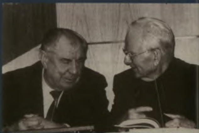
С министром обороны СССР Д. Т. Язовым