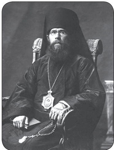
Архиепископ Аркадий. Омск. 1910-е гг. Archbishop Arkady. Omsk. 1910s.

цель монополизации влияния на сознание населения, ликвидировав церковь как социальный институт культуры. В тех условиях заместителем Патриаршего местоблюстителя был митрополит Сергей (Страгородский). Под давлением власти он принял ряд непопулярных решений, самым известным из них была декларация от 29 июля 1927 г. о поддержке Церковью Советского государства и об осуждении его зарубежных врагов 2 . Политика митрополита Сергея вызвала критику среди части православного духовенства в СССР и за рубежом. Взвешенная оценка причин сотрудничества митрополита Сергея с советским строем дана современным историком М. И. Одинцовым: «...в большинстве своем рядовые верующие