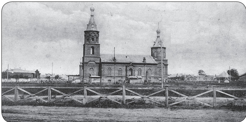
Богородице-Братская церковь в Омске. Конец 1910-х гг.