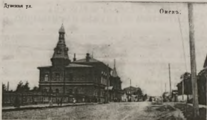
Думская улица, на переднем плане здание Городской думы.