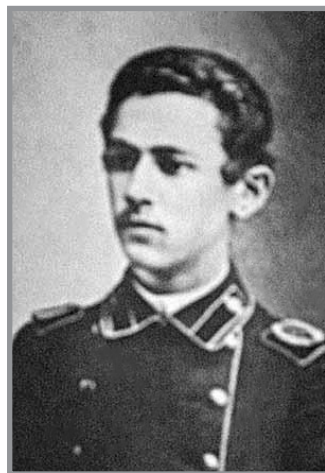
М. А. Новомейский в форме студента Иркутского механико-технического училища. Конец XIX в.

Подобные взгляды, стремление искать вину в людях с еврейским происхождением имели и другие деятели антибольшевистского движения в Сибири. Белый офицер И. С. Ильин, находясь в Омске, 8 января 1919 г. в дневниковой записи