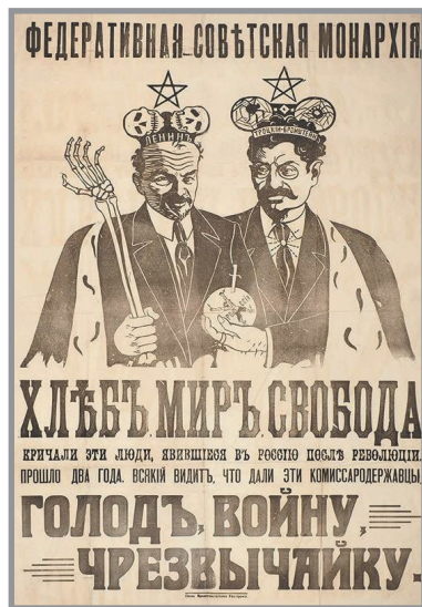
Плакат времен Гражданской войны. 1919 г.

Но в то же время за границей стало известно об антисемитских материалах, выходивших на территории антибольшевистской России, что вынуждало лавировать, официально декларируя идеи о равенстве. Российское правительство А. В. Колчака было сильно заинтересовано в поддержке иностранных союзников. Это касалось и других антибольшевистских сил востока России [36, с. 236 – 238]. Верховный комиссар Великобритании сэра Ч. Элиот 26 мая 1919 г. сказал, что виды на скорое признание правительства адмирала Колчака в общем благоприятны, но адмирал должен помнить, что за границей имеются влиятельные лица, настаивающие на доказательствах того, что правительство не реакционно [37, с. 70]. И среди сотрудников спецслужб омского правительства были люди с довольно националистическими взглядами. Это можно сказать и о заведующем агентурой Особого отдела Управления делами Российского правительства А. В. Колчака полковнике А. В. Караулове (в 1910 – 1917 гг. начальник Одесского жандармского управления).