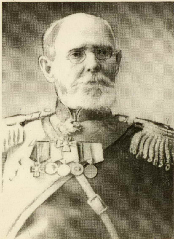
Посвящается 150-летию со дня рождения Г.Е.Катанаева, генерал-лейтенанта Сибирского казачьего войска, ученого, русского патриота